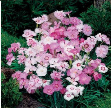
ГВОЗДИКА ПЕРИСТАЯ СМЕСЬ

Многолетник. Пышность цветения, нежный аромат, морозоустойчивость, долговечность, неприхотливость делает этот цветок очень популярным. Любит песчаную почву, хорошо переносит засуху, не любит переувлажнения. Цветет с июля по август, иногда цветет даже два раза за год, любит известковые почвы и солнечные места. После цветения обрезать сухие семенные коробочки и тогда гвоздика будет красоваться своей сизой узкой листвой, разрастаясь в подушку.