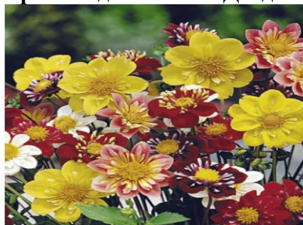
Георгина однолетняя «Денди»

Роскошное однолетнее растение высотой около 50 см. Соцветия яркие, нарядные, разнообразных окрасок, в диаметре 7-10 см. Лепестки двурядные, причем небольшие внутренние лепестки образуют «воротничок». Обильно цветет с июля до заморозков. Для цветников, балконных ящиков, букетов. Семена на рассаду высевают в начале апреля (в мае возможен посев непосредственно в грунт). Рассаду высаживают после окончания заморозков. Осенью клубни можно выкопать и сохранить до весны.