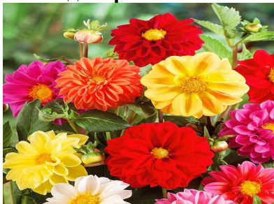
ГЕОРГИНА однолет декоративная

Однолетнее роскошное растение высотой около 50 см. Обильно цветет с июля до заморозков. Соцветия разнообразных окрасок, в диаметре 7-10 см, махровые. Для цветников, балконных ящиков, великолепно смотрится в букетах. Семена на рассаду высевают в начале апреля (в мае возможен посев непосредственно в грунт). Рассаду высаживают после окончания заморозков. Осенью клубни можно выкопать и сохранить до весны.