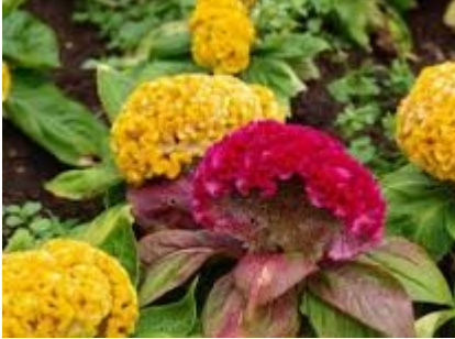
Целозия гребенчатая смесь

Целозия гребенчатая – это яркий однолетний цветок, который успешно выращивают и в дачных условиях, и дома. Растение высотой 15-25см.