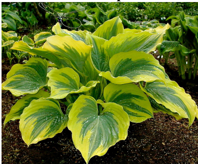
Хоста в ассортименте

Многолетник высотой 20—30 см с красивыми декоративными листьями