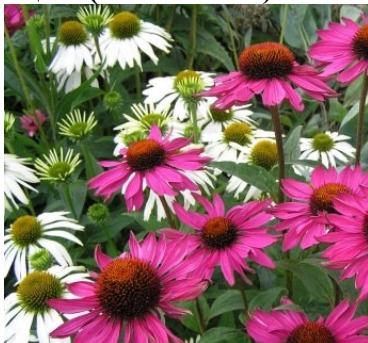
Эхинацея (Echinacea) Розовая

Многолетник высотой 90—100 см с красивыми цветами, напоминающими крупную ромашку розового цвета. Стебли прямые, шершавые. Цветет во второй половине лета и привлекают в сад бабочек, пчел и шмелей. Растение весьма неприхотливо. Цветы декоративны и обладают качествами медоноса.