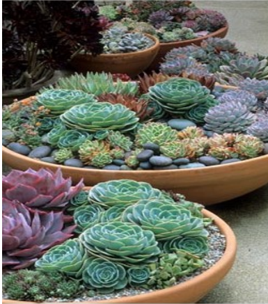
Эхеверия (Каменная роза).

Бесстебельные, многолетние, травянистые, низкорослые растения с коротким разветвленным мясистым стволом. Листья расположены очень густо, спирально, образуют розетку, цельнокрайные, более или менее мясистые, от плоских до округлых, зеленые. В народе это растение часто называют «каменный цветок», «каменная роза», «зеленая роза».