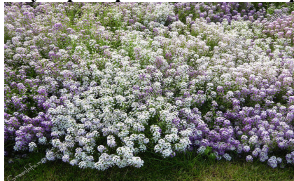
Лобулярия фиолетовый ковер

Однолетнее растение высотой около 15 см. Обильно и непрерывно цветущий до заморозков сорт. Многочисленные фиолетовые цветки собраны в кисти соцветий, имеют приятный медовый аромат, образуют красивый ковер. Для балконов, создания цветочных ковров, альпийских горок. Посев семян производят непосредственно в грунт в конце апреля-мае. Для непрерывного цветения удаляют увядшие цветки.